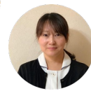
バックヤード 白崎

『トリュフ塩』です。料理の仕上げに一振りするだけで芳醇な香りをプラスできます。卵料理やリゾットにおすすめです。