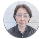
バックヤード 大坪